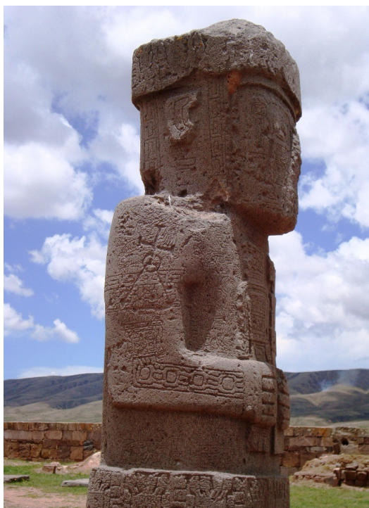
Figura 02 – Monolito Ponce

O monumento em pedra representa uma relação entre colonizador e colonizado que registra a intolerância e violência dos agentes coloniais. A fotografia abaixo registra um resquício colonial coerente com as cartas jesuíticas compiladas por Cortesão (1952), permanece ainda hoje no complexo arqueológico de Tiwanaku, Bolívia, próximo de onde começaram as reduções jesuíticas das terras baixas americanas, a partir de Juli, Peru, como testemunho da catequese aliada à colonização.