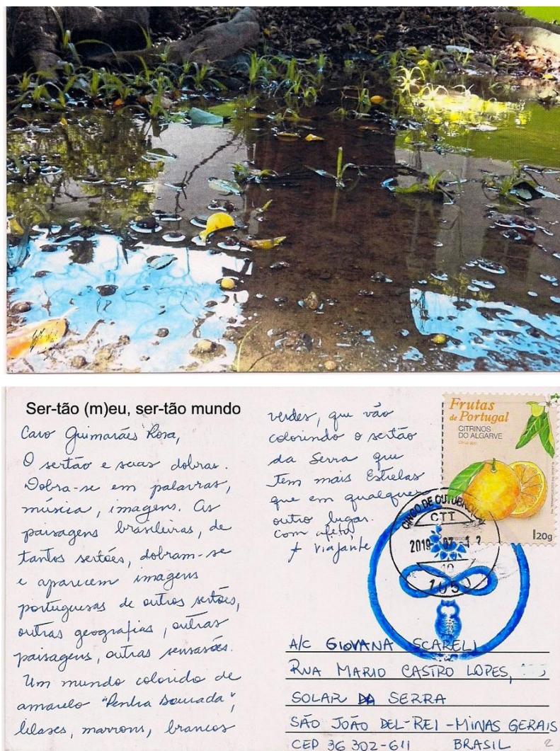
Figura 1 - Cartão-foto-postal (frente e verso)