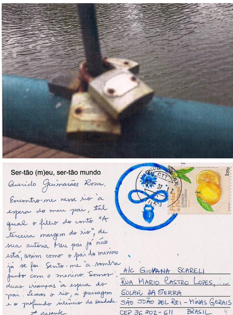
Figura 3 - Cartão-foto-postal (frente e verso)