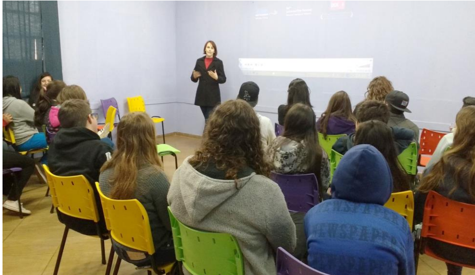
Figura 1 – Debate posterior à sessão na Escola Vasco da Gama