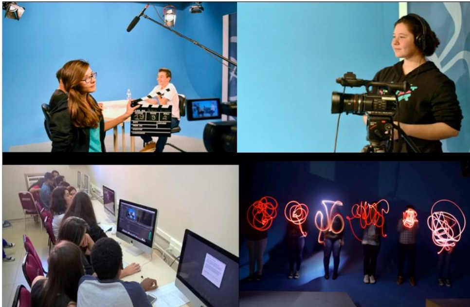
Figura 4 – Registros de atividades práticas realizadas pelos participantes do Cine Diversidade