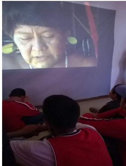
Figura 2 – Exibição de curta sobre a questão indígena na Escola Paulo Freire