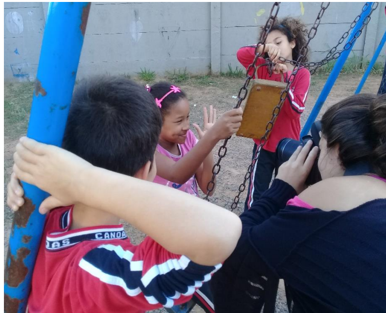
Figura 3 – Alunos em atividade durante a oficina da Escola Paulo Freire