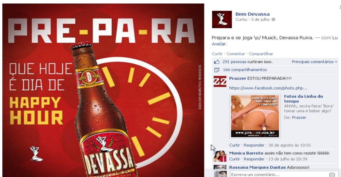
Figura 03 – Interação da cerveja devassa na sua página do Facebook

De acordo com o modelo proposto por Argyle (1976), cada indivíduo envolvido em uma interação estabelece as suas ações a partir de um objetivo, assim como em uma atividade motora. Nesse sentido, sua percepção social é pragmática: é sempre intencional, com finalidades, em busca do fazer pelo falar. Isto é, “cada pessoa quer que a outra responda de maneira associativa, submissa ou dominante, segundo sua própria estrutura motivacional” (ARGYLE, 1976, p. 216). Interagir é estabelecer finalidades, seja por meio persuasivo, seja com o objetivo de estabelecer laços que adicionam mais elementos à rede social (ver figura 3). No caso aqui analisado, à marca cabe a criação de textos relevantes, que atraiam a atenção e o possível compartilhamento, construindo elevado “capital social” (BOURDIEU, 1983) para o estabelecimento de mais e mais fortes interações.