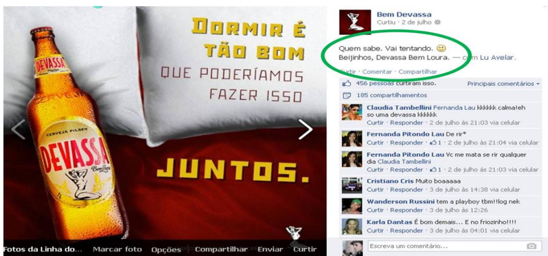
Figura 01 – Interação da cerveja Devassa com seu público em sua página do Facebook

Na figura 01, pode-se reconhecer estes atributos pelas escolhas engendradas pela marca na composição da sua persona interacional: a opção por identificar-se (pela foto escolhida para compor o seu perfil) a partir não do rótulo do produto, mas apenas de um dos seus elementos que corporificam a silhueta de uma mulher – neste caso, a marca instaura a sua intenção retórica de ser percebida como um simulacro de indivíduo, e não como uma organização; a utilização dos recursos escritos como forma de construção enunciativa de uma persona com características de gênero e humor peculiares àquelas já entendidas no seio cultural como específicas do contexto feminino – a representação de si como algo a ser conquistado e a utilização do diminutivo (“beijinhos”) no trato com o seu interlocutor.