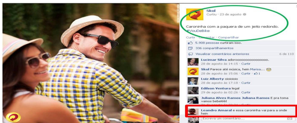
Figura 02 – Interação da marca Skol com seu público no Facebook

correspondência entre bens e grupos”. Assim, utilizar as hashtags e afirmar o uso da bicicleta como melhor forma de locomoção é uma maneira de a marca construir o seu self por meio do habitus da classe de indivíduos que deseja atingir com a sua comunicação estratégica. Este habitus , identificado pela marca, serve à mesma como matéria-prima para a construção da sua subjetividade no ciberespaço, corroborando sua identificação a gostos que atestam a suposta veracidade do ethos que deseja representar.