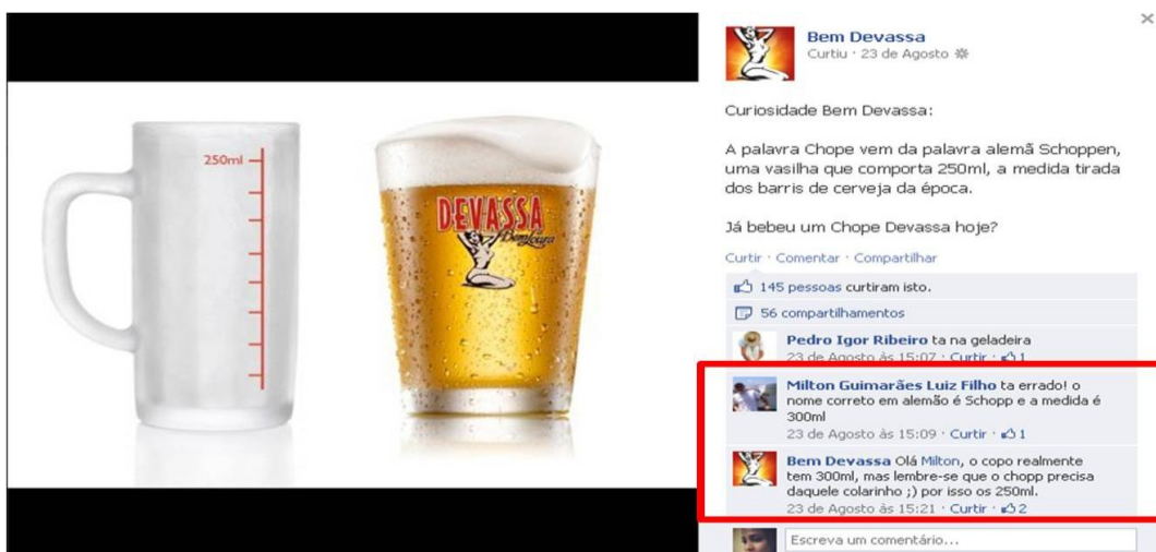
Figura 04 - Interação da marca Devassa no Facebook

A habilidade social da marca: uma reflexão sobre interação marca-indivíduo no ambiente digital